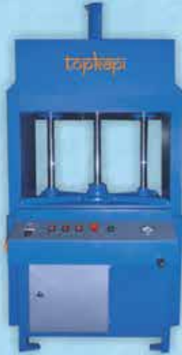
PRES / LAMINATION PRESS