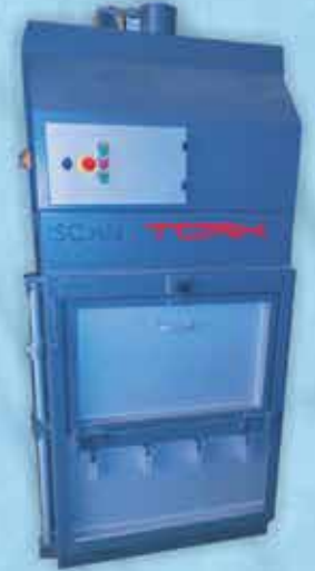
HURDA PRESİ / BAIUNGN PRESS MACHINE