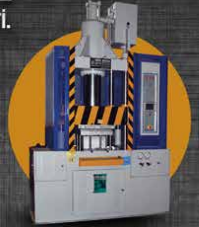
HP-DÇ 160/80 TON