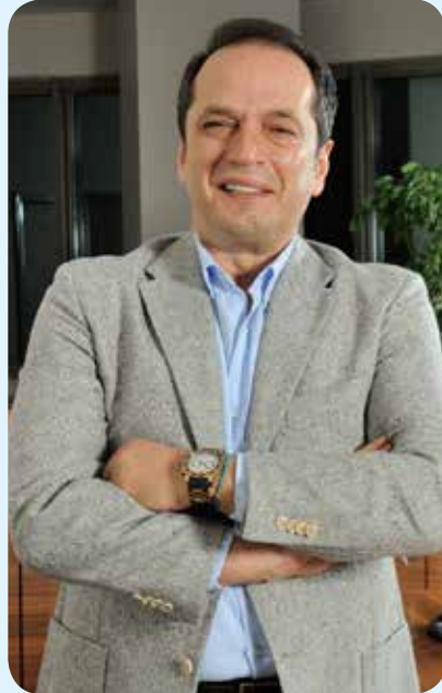
ESENYURT'UN, KENDİNE YAKIŞIR BİR HASTANESİ VAR: ESENCAN HASTANESİ