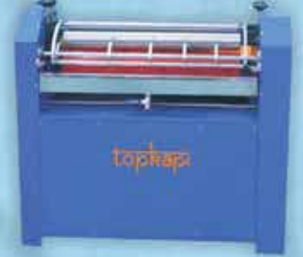
SIVAMA / MANUEL CLUE MACHINE