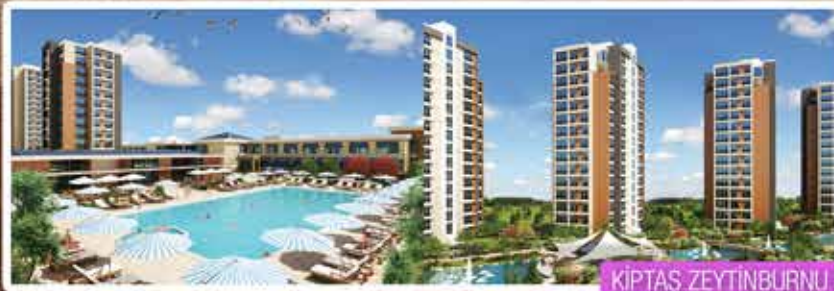
KIPTAŞ ZEYTİNBURNU SAHILPARK

İnönü Mh. Doğan Araslı Cd. Şelale Plaza K:7 D:70 Esenyurt / İSTANBUL Tel: +90 212 872 08 09 Faks: +90 212 872 08 40 info@artosyapi.com.tr