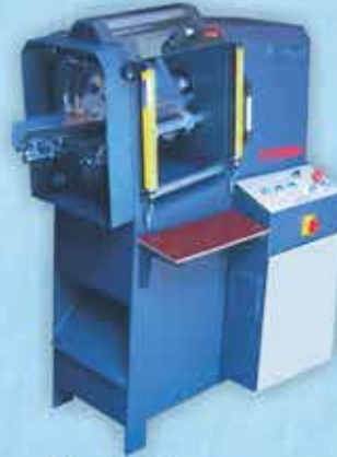
ETİKET PRESİ / LABEL PRESS