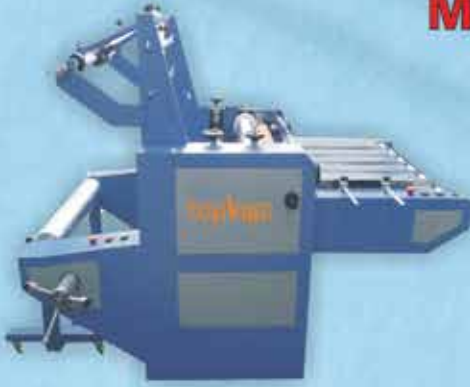
SELEFON / MANUEL OPP FILM LAMINATION