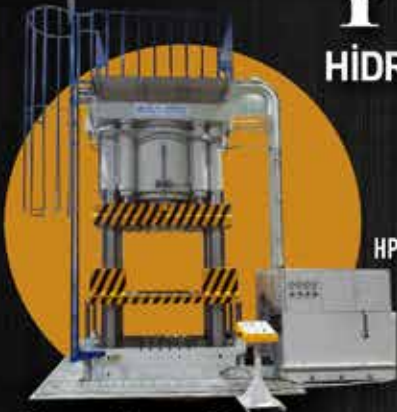
HP-F 2000/100 TON