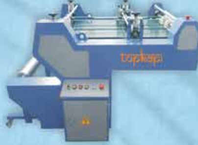
KOPARMA / OPP FILM CUTTER MACHINE