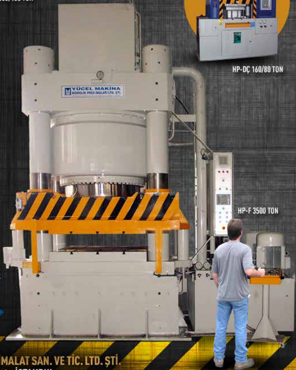
HP-F 3500 TON

YÜCEL MAKİNA HİDROLİK PRES İMALAT SAN. VE TİC. LTD. ŞTİ.